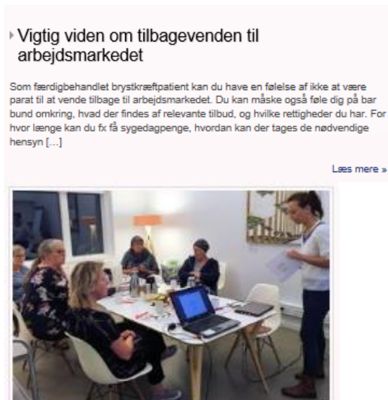
Eksempel fra kreds Hovedstaden